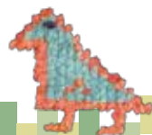
Ketab ¥450,000-(税別) 407cm×102cm Kordestan Wool