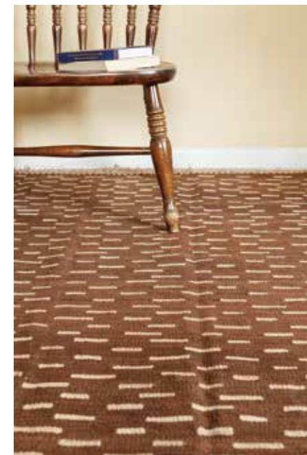
KQ107 / ¥170,000- / 250cm×142cm/Qashqai/Wool

神奈川県中郡大磯町高麗2-9-3 TEL: 0463-61-9622 URL: www.sedaikobo.com