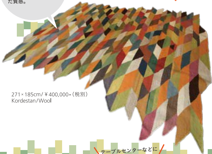
271×185cm / ¥ 400,000- (税別) Kordestan/Wool