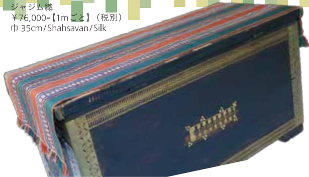
ジャジム織 ¥ 76,000-【1mごと】 (税別) 巾 35cm/Shahsavan/Silk