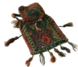
塩袋 / ¥15,000- 53cm×32cm/Sanjab/Wool