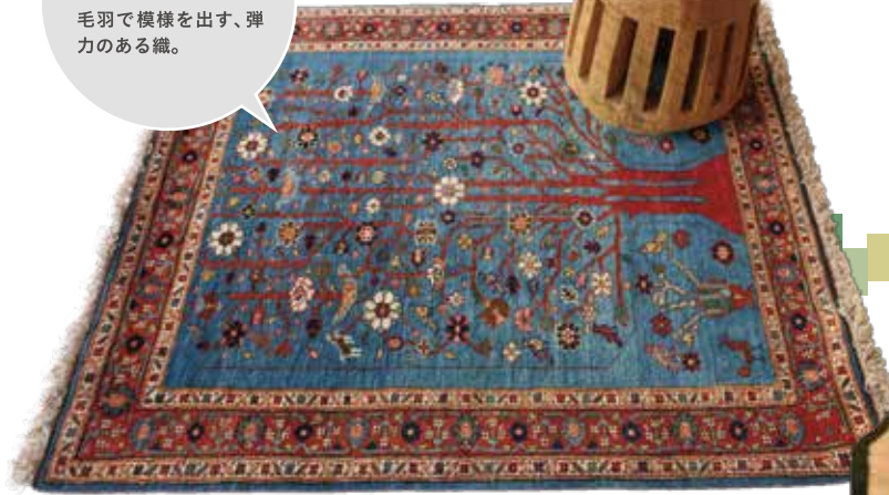
Aroosi Mahnaz / ¥ 600,000- (税別) 110×95cm/Qashqai/Wool