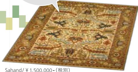
Sahand / ¥ 1,500,000- (税別) 290×209cm/Shahsavan/Wool