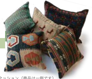
クッション (商品は一例です) ¥ 13,000~ (税別) / Wool