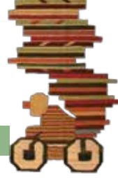
遊牧民の布団入れ インテリアカバー などとして