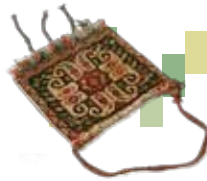
チャンテ(バッグ) / ¥ 30,000- (税別) 30cm×35cm/Qashqai/Wool